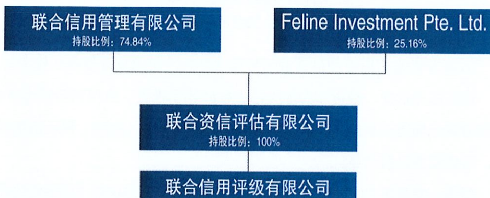
图 1 公司股权结构图

公司地址：天津市和平区曲阜道 80 号联合信用大厦 4 层/北京市朝阳区建国门外大街 2 号 PICC 大厦 10 层。公司实际控制人为王少波，法定代表人为万华伟。